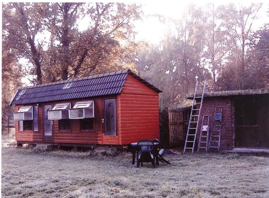
Ein weiterer Reiseschlag auf dem weitläufigen Gelände.