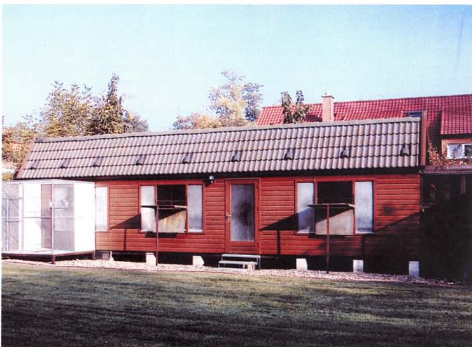
Der große aktive Reiseschlag der Witwer.

Flug. Die schönsten Augenblicke und die größte Faszination erlebt Thomas jedes Mal, wenn die Wettflugtauben schwebend und klatschend vom Flug heimkehren und schon in der Luft ihren unbändigen Siegeswillen zeigen.