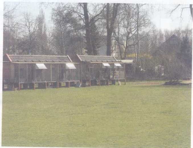
Ein idyllisches Fleckchen Erde: Von Taubenmist ist hier nichts zu sehen.