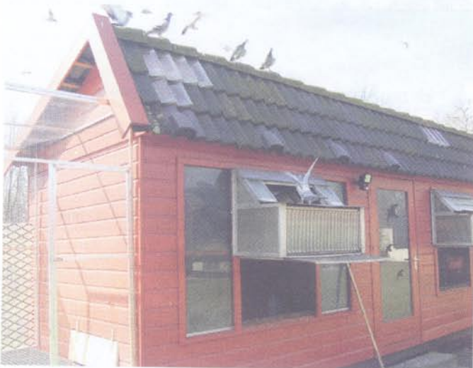
Die Schlaggemeinschaft „Ratz-Bremen-Golletz-Spieß“ hat in Gelsenkirchen ihr Zuhause.