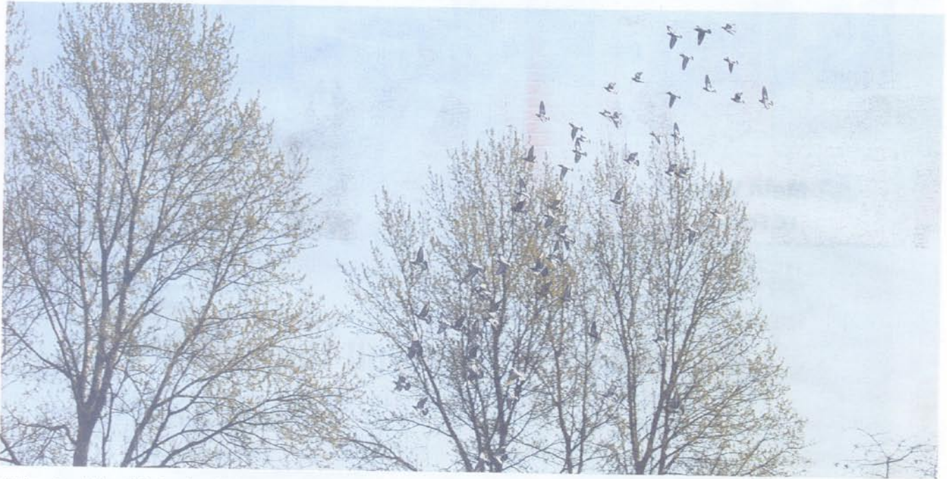
Im Flugverbund ziehen die Tauben der Schlaggemeinschaft „Ratz-Bremen-Golletz-Spieß“ ihre Kreise.